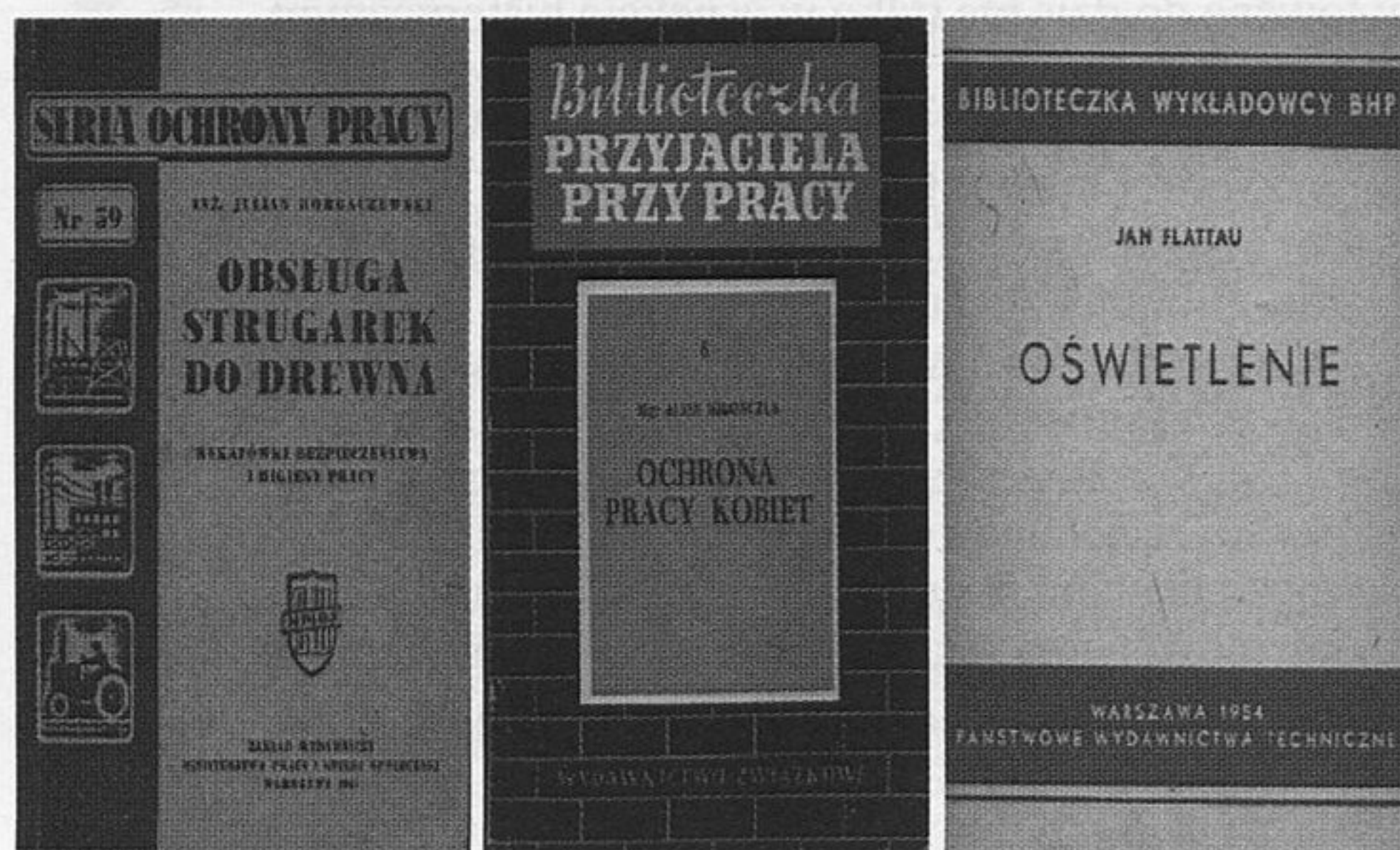
Fot. 1. Okładki ze zbiorów biblioteki CIOP-PIB z lat 50.

W szkoleniach nieocenioną pomocą były publikacje wydawane przez Wydawnictwo Związkowe, Państwowe Wydawnictwa Techniczne, Państwowy Zakład Wydawnictw Lekarskich, Zakład Wydawniczy Ministerstwa Pracy i Opieki Społecznej w znanych seriach (fot. 1.).