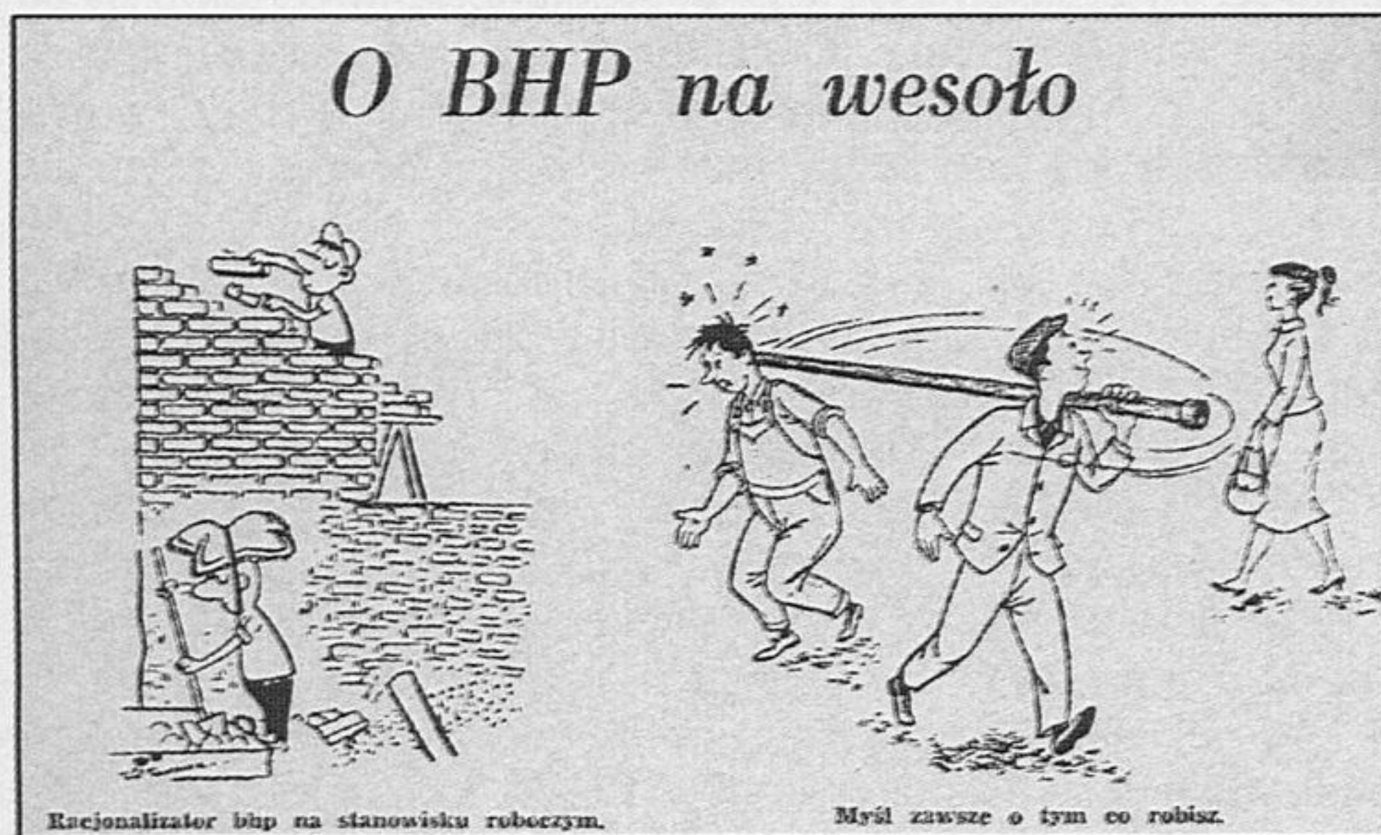
Rys. 6.

Aby czytelnikom ułatwić dotarcie do jakże ciekawych publikacji, które z racji daty wydania nazywamy mianem historycznych i doceniając ich znaczenie dla rozwoju dziedziny jaką jest bezpieczeństwo i ochrona zdrowia człowieka w środowisku pracy, w bibliotece CIOP-PIB są prowadzone prace mające na celu retrokonwersję kart katalogowych. Oznacza to, że za pomocą Internetu czytelnicy będą mogli uzyskać informacje o wydawnictwach z lat 1950 – 1970 i wcześniejszych (rys. 7.).