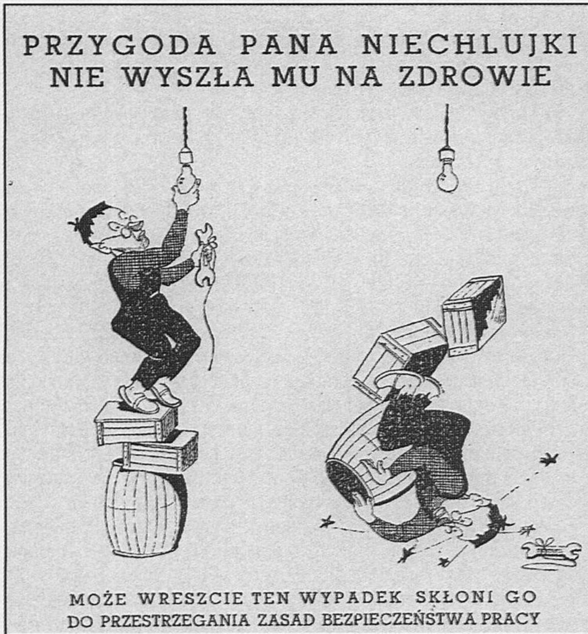
Rys. 5.

Na zakończenie coś lżejszego, co może uatrakcyjni czytelnikom wędrówki po dawnych wydawnictwach z dziedziny bezpieczeństwa i higieny pracy. Redakcja „Przyjaciela przy Pracy” w każdym numerze zamieszczała rebusy, krzyżówki, dowcipy – o bhp na wesoło i humorystyczne przygody Obywatela Śrubki i Pana Niechlujko (rys. 5., 6.).