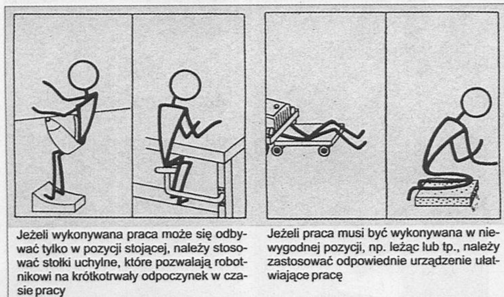
Rys. 1. Wskazówki ergonomiczne z lat 60.

Spośród wspomnianych poradników, dostępnych w bibliotece CIOP-PIB, warto zwrócić uwagę na pozycję [9] z serii Biblioteki Organizatora Produkcji, w której autor J. Wasiak, omawiając aspekty techniczne i organizacyjne stanowiska roboczego w przemyśle metalowym i maszynowym, podkreśla znaczenie właściwego doboru załogi, odpowiednich kwalifikacji i cech psychofizycznych pracowników, zwraca uwagę na aspekt zdrowotny, psychologiczny i socjologiczny pracy zmianowej, a także na ergonomię właściwie zaprojektowanych stanowisk (rys. 1.).