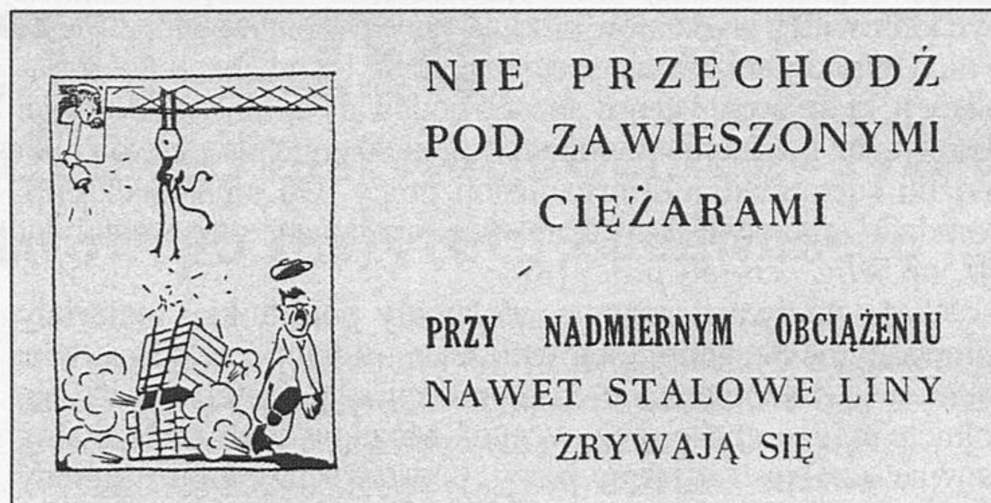
Rys. 3.

Prawdziwą kopalnią wiedzy na temat bogactwa form popularyzatorskich są roczniki miesięczników „Ochrona Pracy” i „Przyjaciół przy Pracy”. Można w nich przeczytać informacje o różnych konkursach – na najlepszy plakat czy na pomysły racjonalizatorskie. Nagradzane prace stanowią swoistą galerię najlepszych plakatów i rysunków z dziedziny bhp (rys. 4.).