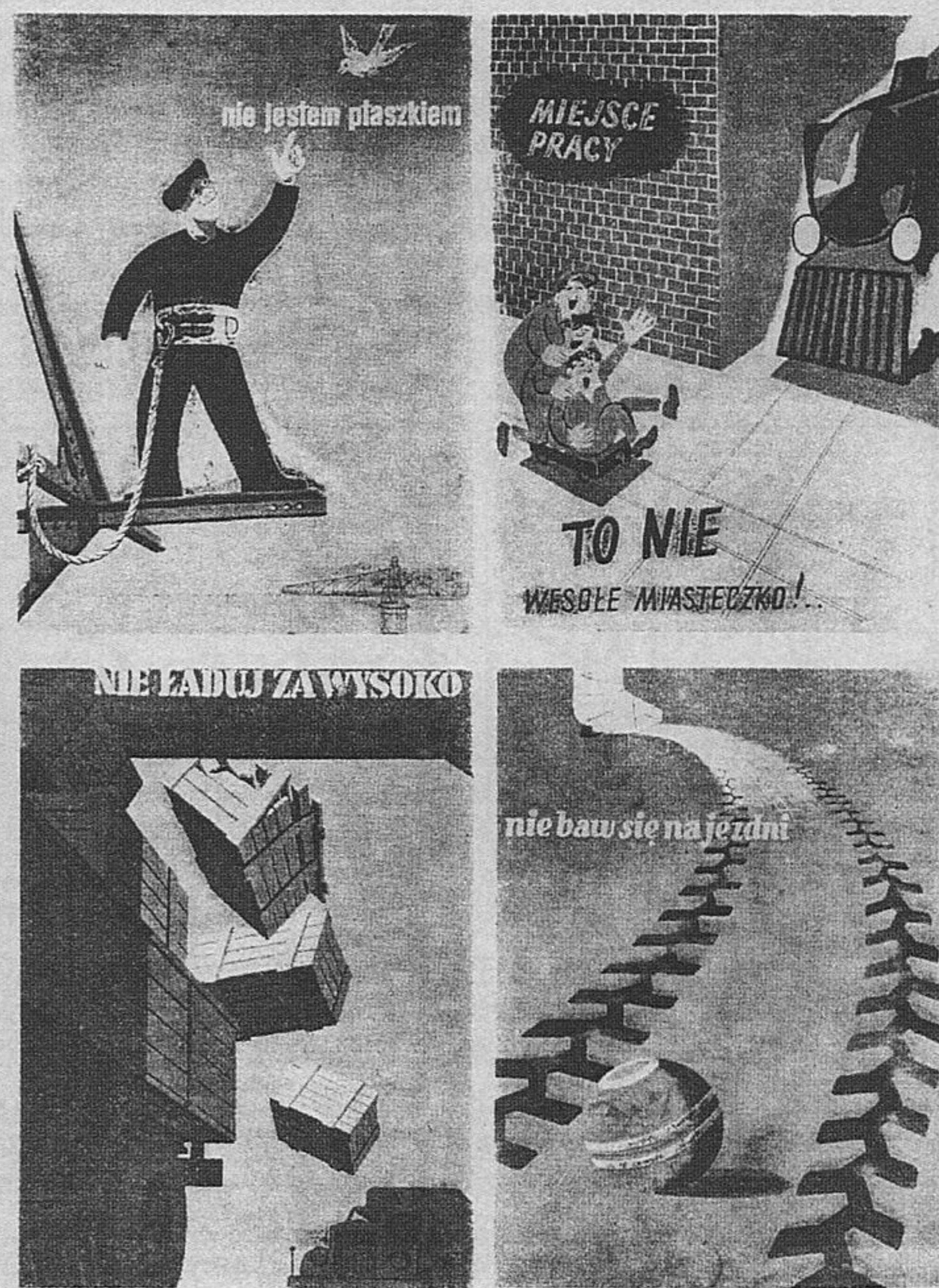
Rys. 4.