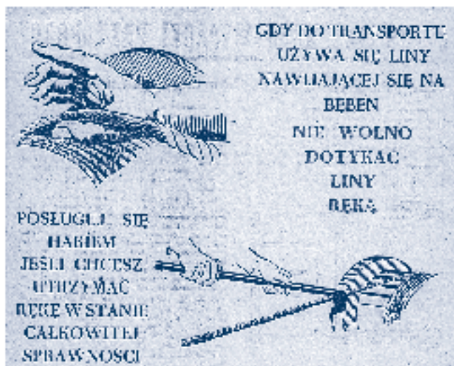
Rys. 2.

Do szkoleń i instruktażu robotników z zakresu bezpieczeństwa i higieny pracy przywiązywano dużą wagę. Zdawano sobie sprawę z tego, że przekazywane treści muszą być jasne, przejrzyste, łatwo i szybko trafiające do robotników (rys. 2).