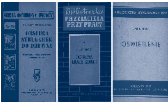
Fot. 1. Okładki ze zbiorów biblioteki CIOP-PIB z lat 50.

W szkoleniach nieocenioną pomocą były publikacje wydawane przez Wydawnictwo Związkowe, Państwowe Wydawnictwa Techniczne, Państwowy Zakład Wydawnictw Lekarskich, Zakład Wydawniczy Ministerstwa Pracy i Opieki Społecznej w znanych seriach (fot. 1.).