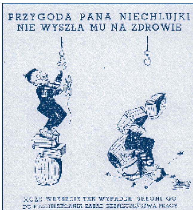
Rys. 5. Źródło „Przyjaciel przy Pracy”, 1953

Na zakończenie coś lżejszego, co może uatrakcyjni czytelnikom wędrowki po dawnych wydawnictwach z dziedziny bezpieczeństwa i higieny pracy. Redakcja „Przyjaciela przy Pracy” w każdym numerze zamieszczała rebusy, krzyżówki, dowcipy – o bhp na wesoło i humorystyczne przygody Obywatela Śrubki i Pana Niechlujko (rys. 5., 6.).