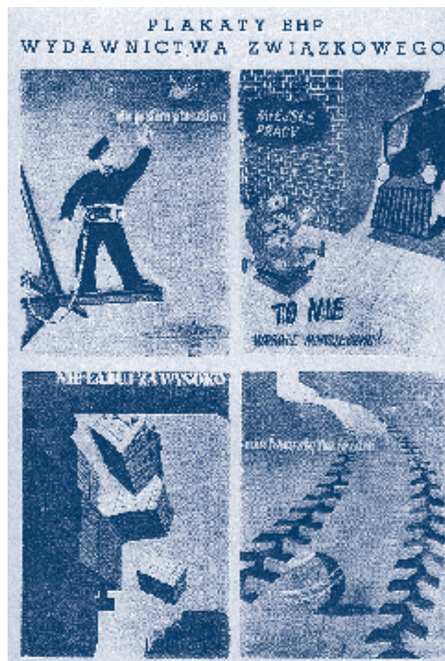
Rys. 4.