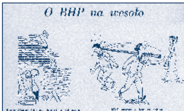
Rys. 6.

Aby czytelnikom ułatwić dotarcie do jakże ciekawych publikacji, które z racji daty wydania nazywamy mianem historycznych i doceniając ich znaczenie dla rozwoju dziedziny jaką jest bezpieczeństwo i ochrona zdrowia człowieka w środowisku pracy, w bibliotece CIOP-PIB są prowadzone prace mające na celu retrokonwersję kart katalogowych. Oznacza to, że za pomocą Internetu czytelnicy będą mogli uzyskać informacje o wydawnictwach z lat 1950 – 1970 i wcześniejszych (rys. 7.).