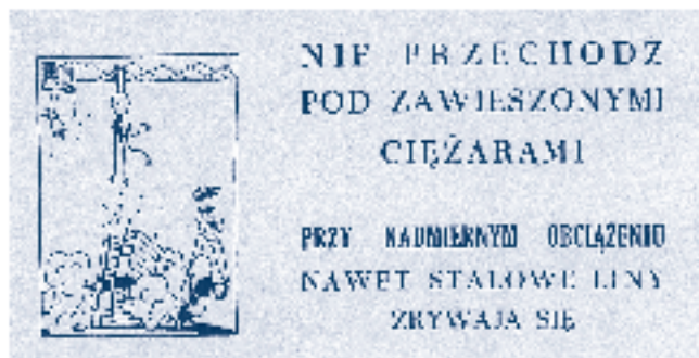
Rys. 3.

Prawdziwą kopalnią wiedzy na temat bogactwa form popularyzatorskich są roczniki miesięczników „Ochrona Pracy” i „Przyjaciel przy Pracy”. Można w nich przeczytać informacje o różnych konkursach – na najlepszy plakat czy na pomysły racjonalizatorskie. Nagradzane prace stanowią swoistą galerię najlepszych plakatów i rysunków z dziedziny bhp (rys. 4).