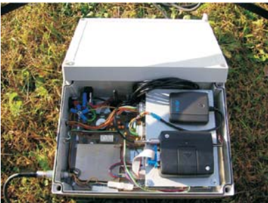
Fot. Bezobsługowa stacja pomiarowa Photo. Automatic noise measurement station

nowania satelitarne GPS, który pozwala na powiązanie wyników pomiarów poziomu hałasu z danymi dotyczącymi lokalizacji miejsca, w którym dany pomiar się odbył. Ponadto zastosowanie standardowego komputera stanowi odpowiednią platformę sprzętową, którą można, przy małym nakładzie pracy i kosztów, w prosty sposób rozbudowywać o dodatkowe elementy funkcjonalne. Można, zatem, podłączać czujniki gazu, kamerę wizyjną, czujniki wielkości meteorologicznych (prędkości i kierunku wiatru, temperatury, ciśnienia) [4]. Na fotografii przedstawiono opracowaną w Katedrze Systemów Multimedialnych Politechniki Gdańskiej, prototypową stację monitorowania hałasu.