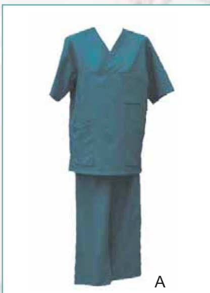
Fot. 2. Ubranie zakładane pod odzież chirurgiczną – zestaw A

modelu skóry i ocenę ilościową ich właściwości fizjologicznych. Pracownicy tego instytutu opracowali certyfikat Hohenstein Quality Label „Breathability”, przyznawany odzieży medycznej spełniającej warunek odporności na przenikanie pary wodnej, mierzonej na modelu skóry zgodnie z PN-EN 31092:1998/Ap1:2004 [8] poniżej 17 m 2 Pa/W. Wartość ta została ustalona w ramach badań prof. Umbacha [9], w których określono korelację między odpornością na przenikanie pary wodnej barierowego materiału a maksymalną temperaturą środowiska, w jakiej użytkownik wciąż odczuwa komfort.