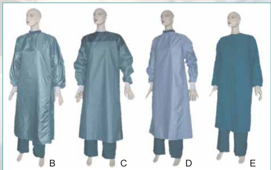
Fot. 3. Rodzaje fartuchów oraz zestawy ubrania chirurgicznego zastosowane w badaniach – zestawy B, C, D, E

Photo 2. Clothing worn under surgical clothing – set A