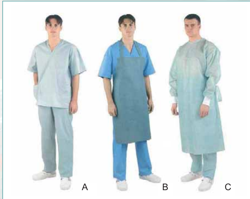
Fot. 1. Trzy zestawy odzieży medycznej Photo 1. Three sets of medical clothing

W lutym 2006 r. została opublikowana trzyczęściowa norma PN-EN 13795 Obłóżenia chirurgiczne, fartuchy chirurgiczne i odzież dla bloków operacyjnych, stosowane jako wyroby medyczne dla pacjentów, personelu medycznego i wyposażenia [7], w której po raz pierwszy zostały odpowiednio zdefiniowane wymagania pozwalające na klasyfikację odzieży chirurgicznej z barierą ochronną. Dokument ten precyzuje wymagania (limity) dotyczące wydajności odzieży medycznej, które zależą m.in. od typu operacji, czasu jej trwania, ekspozycji na płyny i zmęczenia mechanicznego. Ponadto odzież taka musi spełniać wszystkie kryteria zgodności z dyrektywą Rady z dnia 14 czerwca 1993 r. (93/42/EWG) dotyczącą wyrobów medycznych, co sprawia, iż produkty jednorazowe, tak popularne nie tylko w Polsce z uwagi na przystępną cenę, zostają w dużym stopniu wyeliminowane z rynku, z powodu ryzyka związanego z pyleniem i ubogą barierą ochronną. Z tych samych powodów niemożliwe staje się stosowanie na bloku operacyjnym odzieży zawierającej komponenty bawełniane. Z kolei tzw. materiały „funkcjonalne”, jak mikrofaza i laminaty, podlegają starannej selekcji pod względem długości okresu zachowania