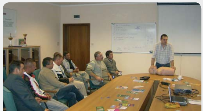
Fig. 1. Ways of informing employees about the occupational risk [7]