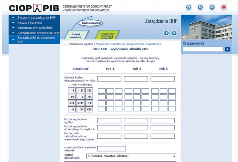
Rys. 1. Strona internetowa portalu CIOP-PIB: www.ciop.pl/18738.html udostępniająca możliwość wyliczenia składki na ubezpieczenie wypadkowe

1,5 – jeśli kategoria ryzyka ustalona dla płatnika składek jest wyższa o co najmniej 6 kategorii od kategorii ryzyka ustalonej dla grupy działalności.