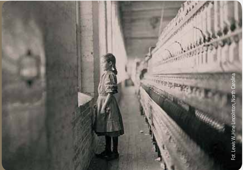
Fot. Lewis W. Hine, Lincolnton, North Carolina

It is possible to photograph work, which sometimes has further implications. The photographer Lewis Hine documented child labor in factories, mills and mines in the USA in the first half of the 20th century and in this way helped the National Child Labor Committee initiate a discussion on the working conditions of children in America. This contributed to the improvement in the situation of young workers. Nowadays photography is also used to promote issues concerning health and safety at work. A photo competition of the European Agency for Safety and Health at Work is an example.