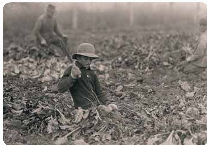
Praca na farmie, Fort Collins, Colorado

Osobą wspomagającą w tych działaniach Komitet był Lewis Hine – fotograf, który porzucił pracę nauczyciela i podróżując po USA dokumentował warunki pracy, z jakimi mieli do czynienia młodociani we wszystkich sektorach przemysłu. Ze zdjęć Hine'a spoglądają umorusane twarze małych górników, którzy dopiero co wyszli na powierzchnię z kopalni, na pierwszy plan wysuwają się zaciekawione twarze drobnych istot wprawiających w ruch kilkakrotnie od nich większe urządzenia w wielkich halach fabrycznych czy młynach. Fotograf często używał podstępów, chcąc pokazać realia, w jakich przyszło pracować nieletnim. Nadzorującym i kierownikom fabryk opowiadał na przykład, że interesują go maszyny i to o ich zdjęcia mu chodzi, chociaż w rzeczywistości w centrum jego uwagi były obsługujące maszynę dzieci. Wykonane fotografie Hine starał się uzupełnić dokładnymi informacjami i liczbami. Pod różnymi pretekstami przeprowadzał z dziećmi wywiady, a uzyskane informacje skrętnie zapisywał.