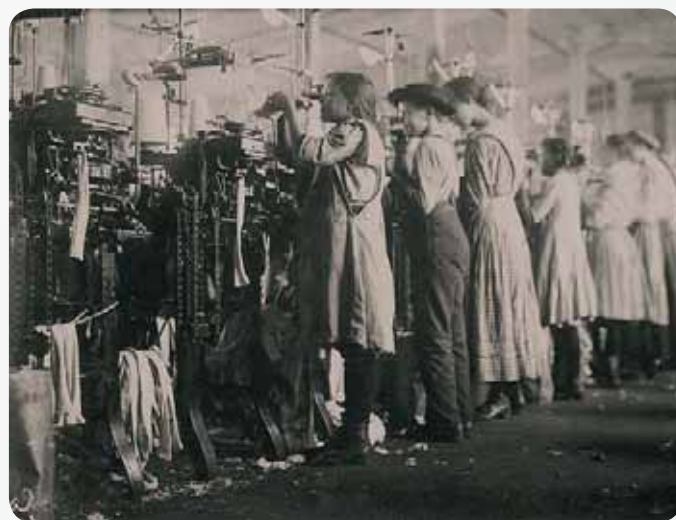
Zakłady tkackie, London, Tennessee