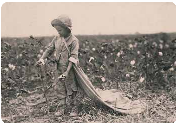
Praca na farmie, Comanche County, Oklahoma