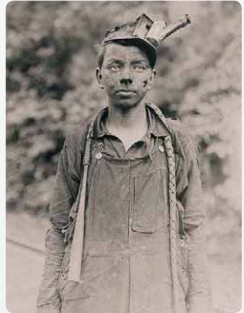
Młody kierowca w kopalni węgla kamiennego, Brown, West Virginia

norującą działania na rzecz dzieci i młodzieży ( Lewis Hine Awards for Service to Children and outh ). Nagroda ta stała się stałą i rozpoznawalną na poziomie całych Stanów Zjednoczonych częścią programu Krajowego Komitetu ds. Dzieci Przymuszanych do Pracy.