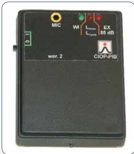
Fot. Wskaźnik dozymetryczny opracowany w CIOP-PIB Photo. Dosimetric indicator researched in CIOP-PIB