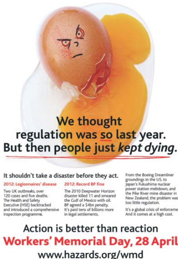
Fot. 2. Plakat promujący Międzynarodowy Dzień Pamięci