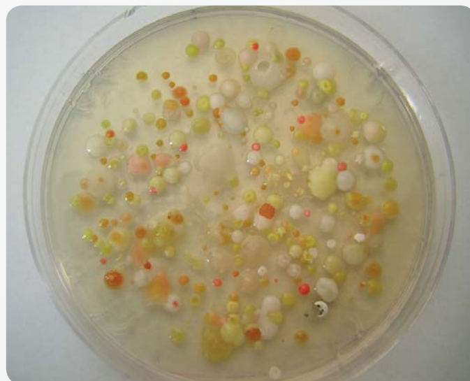
Fot. 2. Kolonie bakteryjne z próbek mgły olejowej na podłożu TSA Photo 2. Bacterial cultures from oil mist samples on TSA medium

Mikrobiologiczne zanieczyszczenie cieczy obróbkowych może istotnie wpływać na skład mikrobioty mgły olejowej, szczególnie w odniesieniu do drobnoustrojów bakteryjnych (fot. 2.). Jak stwierdzili na podstawie przeprowadzonych badań Cyprowski i wsp., bakterie obecne w cieczach obróbkowych oraz w powietrzu przy maszynie charakteryzowały się podobnym składem gatunkowym (m.in. Micrococcus luteus , Staphylococcus warnerii ,