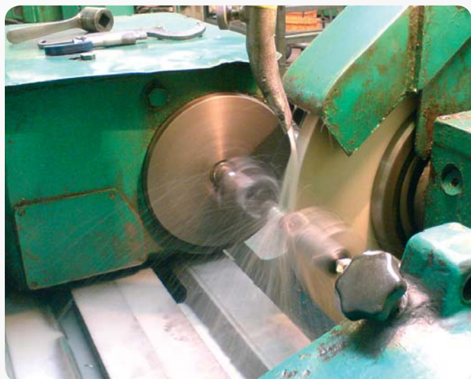
Fot. 1. Emisja mgły olejowej podczas pracy szlifierki Photo 1. Emission of oil mist during the work of a grinder

Najpowszechniej stosowanymi cieczami chłodząco-smarującymi są emulsje wodno-olejowe, sporządzane z koncentratów, które miesza się z wodą w dowolnym stosunku, w celu uzyskania stabilnej emulsji. Zawartość oleju w koncentracie jest zazwyczaj nie mniejsza niż 60%. Pozostałą część stanowi emulgator i różnego typu dodatki modyfikujące: inhibitory korozji i utleniania, przeciwzużyciowe, przeciwzatarciowe, biocydy lub biostaty. W trakcie obróbki z dużymi prędkościami skrawania, przy niewielkich obciążeniach w strefie kontaktu narzędzia z obrabianym materiałem stosuje się emulsje wodno-olejowe, zawierające najczęściej od 2% do 8% (v/v) oleju emulgującego [2].