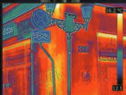
Obraz termowizyjny z MSX®

Opatentowana technologia FLIR MSX® umożliwia odczytanie znaków drogowych, a nawet napisów na ścianach, nałożonych na obraz termiczny.